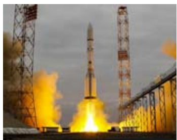
Le volet 2016 d'ExoMars a été lancé.

Ces analyses très précises seront réalisées par les spectromètres NOMAD (infrarouge et UV) et les français ACS. Leur précision est inégalée : ils sont capables de mesurer des concentrations inférieures à un ppb (soit moins qu'un micro-