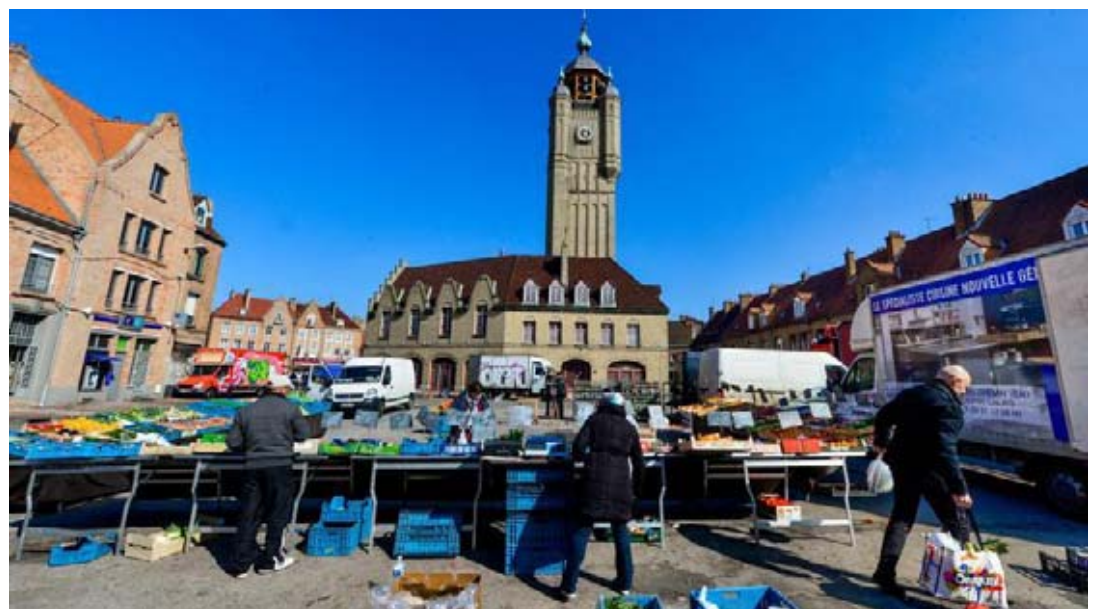
Les Nordistes déplorent une nouvelle appellation sans histoire.