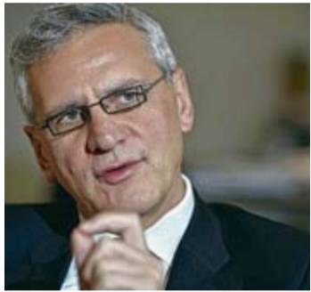
Kris Peeters figure de proue du CD&V pour le scrutin.

Il a encore été beaucoup question de la N-VA, ce week-end. Dans le texte, ou entre les lignes... A la réception de Nouvel An du CD&V, samedi, notamment. Le parti s'y est affiché plein d'optimisme, sûr de détenir les bonnes solutions socio-économiques pour la prochaine législature. Finie la sinistrose : Kris Peeters, figure de proue du CD&V pour le scrutin, pointe les « choix positifs » de son parti pour « une Flandre chaleureuse », contrairement à ceux qui « ralentent », ou se contentent de « cris ». La N-VA n'est jamais citée mais elle est ciblée. C'est l'adversaire à battre. Tout cela confortera le politologue de la KUL, Bart Maddens, réputé proche de la N-VA et qui nous accorde une interview, dans sa conviction qu'un gouvernement de droite avec la N-VA relève de « la science-fiction ». Et que le plus probable est la reconduction d'une tripartite classique. ■