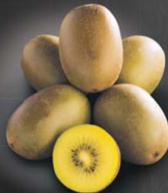
Kiwi Gold, 6 pcs