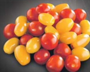
Tomates cerises rouges/jaunes

Délicieusement frais et bien de chez nous