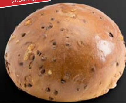
Pain frais aux pépites de chocolat