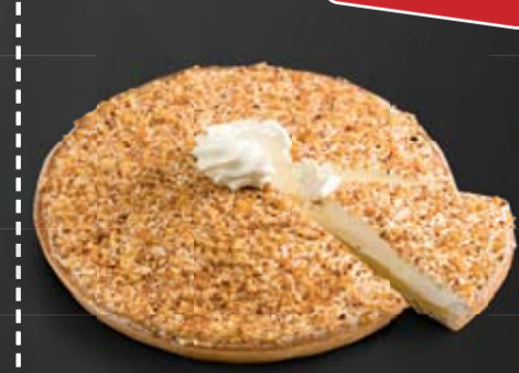
Tarte brésilienne fraîche