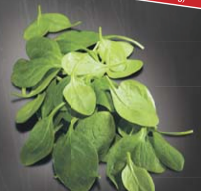
Épinards au rayon frais

Délicieusement frais et bien de chez nous