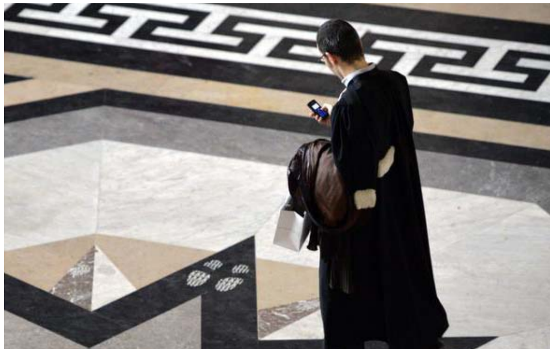
L'ensemble des magistrats du pays font le même constat : la Justice manque de budget.

► Dix mercuriales identiques prononcées comme un cri de révolte.