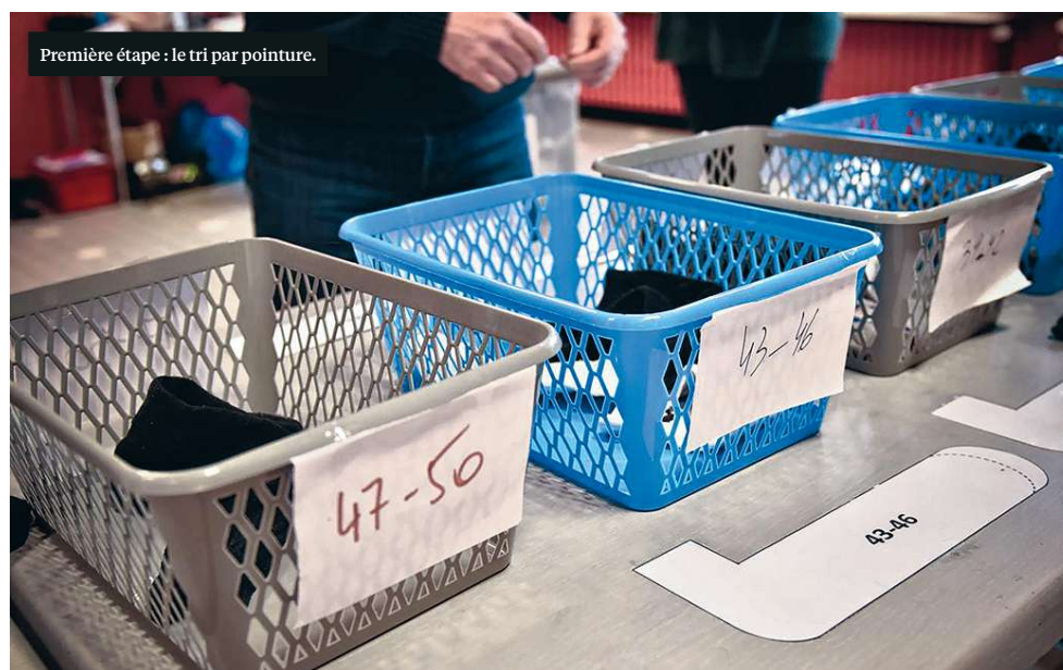
Première étape : le tri par pointure.